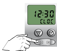
Stel huidige tijd in